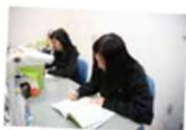
今日の復習は今日のうちにね 雄飛学塾でも勉強できるよ！