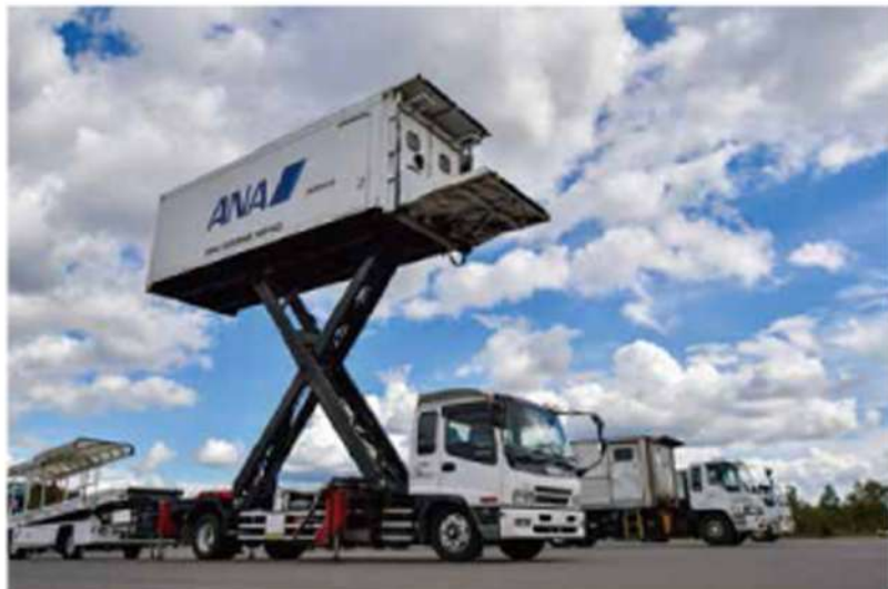
空港技術科機材 (実際に空港で使用している機材)