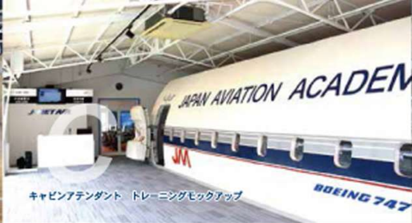
キャビンアテンダント トレーニングモックアップ