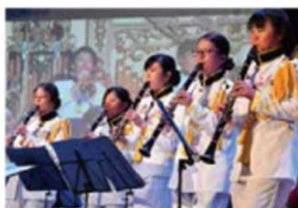
ウインド オークストラ カンパニー（吹奏楽団）