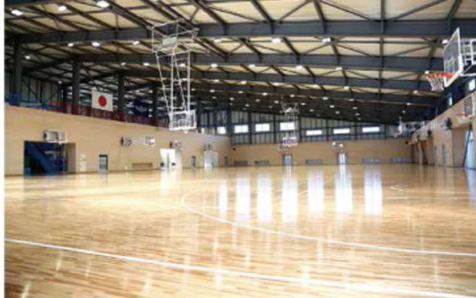
バスケットコート3面・バレーコート1面の最大級の体育館 (J-ship GYM)