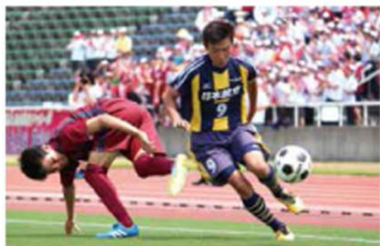
蹴球部 (男子サッカー部)