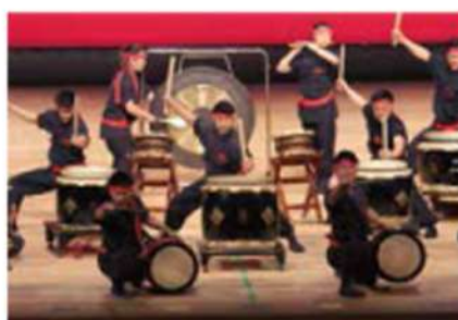
ドラムカンパニー（太鼓隊）

〈卓球部〉 インターハイ14年連続出場 インターハイダブルス3位 団体ベスト16 関東大会個人準優勝 団体3位