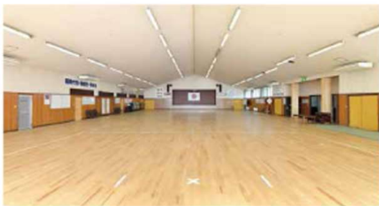
剣道専用の最大級武道館