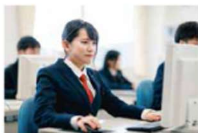
航空工学科の3次元CAD実習

日本航空高等学校は高大一貫教育により、企業へ就職が可能。 また一部の企業へは高等学校からも就職しています！(2020年3月卒業生)