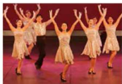
ウィングダンスカンパニー