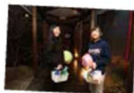
湯岩風呂広々！ゆっくりくつろげますよ