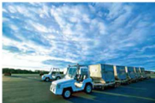
空港技術科機材 (実際に空港で使用している機材)