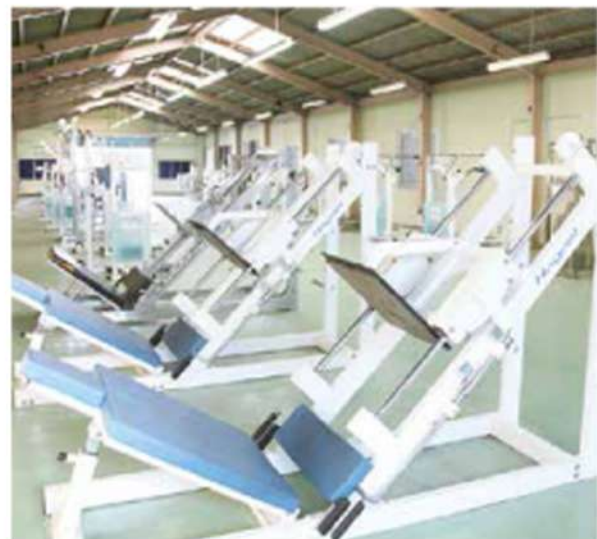
初動負荷トレーニング・ウエイトトレーニング 対応可能なトレーニング施設