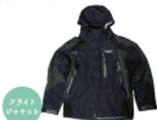
フライト ジャケット