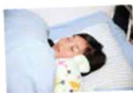
自分のベッドでゆっくり寝よう