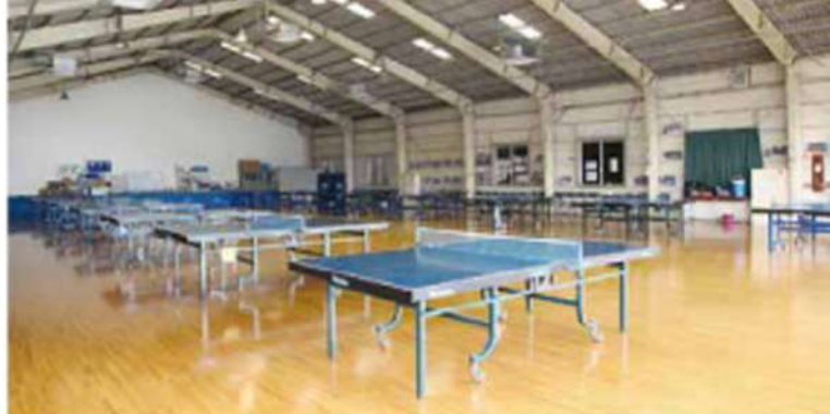
十数台設置してある広い卓球場