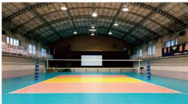
タラフレックスのバレーボール専用体育館（第2GYM）