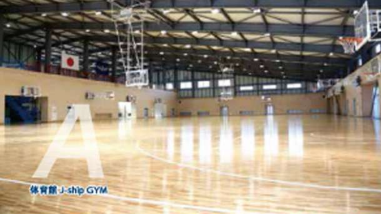
体育館 J-ship GYM