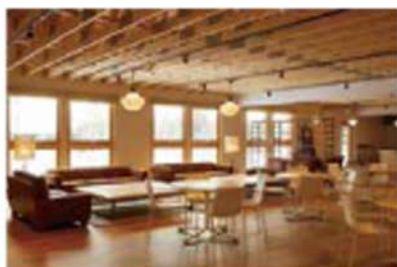
国際航空ビジネス科施設