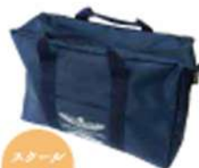
スクーター バッグ