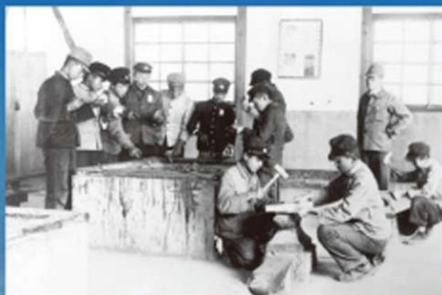
日本航空学園の母体「航空発動機練習所」にて（初期の頃）