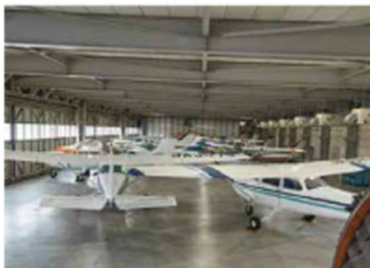
航空整備科格納庫