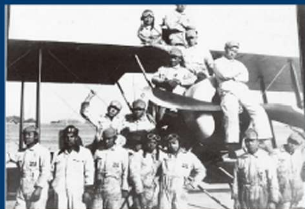
日本航空学園の母体「航空発動機練習所」にて（初期の頃）

発展著しい航空業界や、これからの社会において必要とされるキャリア教育、技術者教育、国際教育を追求し、それら多くの知識や多様な価値観にふれて羽ばたいた卒業生の姿こそ、私達の喜びであり日本航空学園の使命であると考えています。