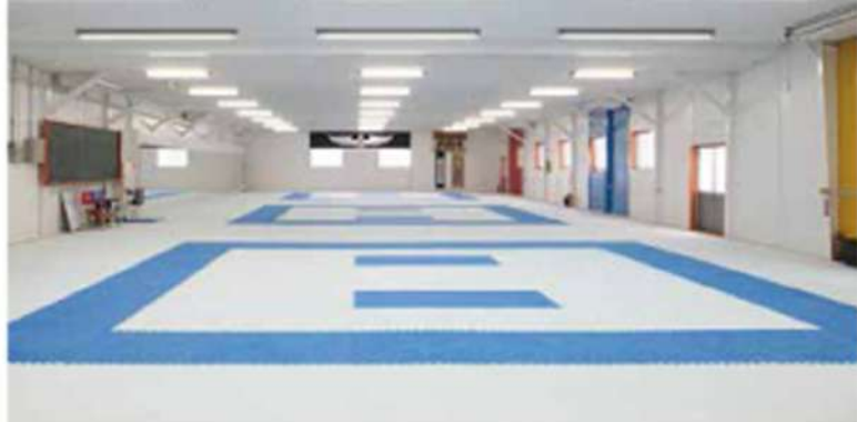
3面コートの空手道場