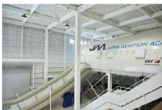
モックアップトレーニングセンター (JAL や ANA をはじめとする大手航空会社や LCC も訓練で使用)