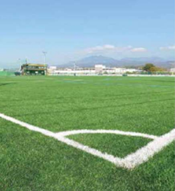
全面人工芝のサッカー場