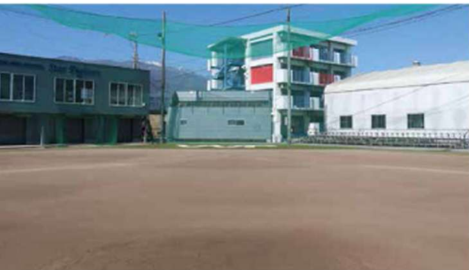
センター 120m、両翼 92m のスタンド完備の野球場