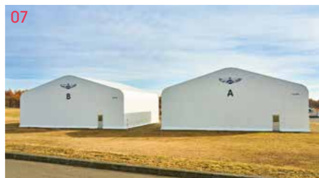
07 実習用車両車庫 空港特殊車両を格納するための車庫。