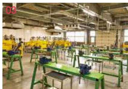
03 実習棟 エンジン実習、溶接、板金作業など実習を行う。