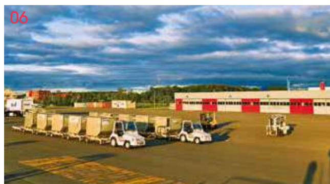
06 実習エリア 飛行機のタキシング(地上滑走)や車両実習をのびのび行える広い敷地。