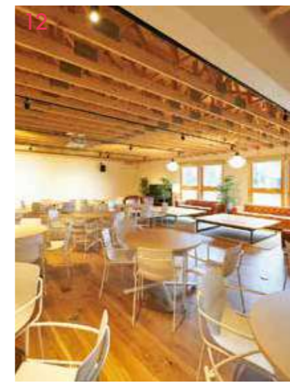
12 キャビントレーニングセンター2 (CTC2) 北欧風のおしゃれな内装が特徴の教室棟。