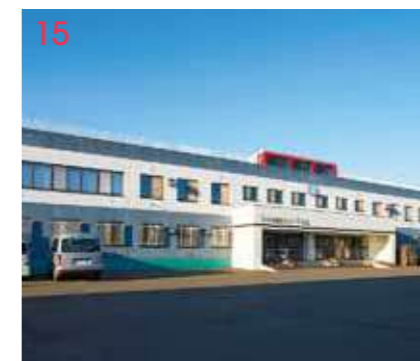
15 リンドバークホール(男子寮) キャンパス内に学生寮があるので通学に便利! 436名収容可能。