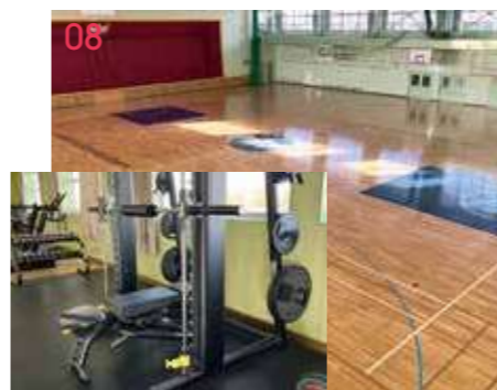
08 体育館 2020年1月に最新トレーニングマシンを導入。