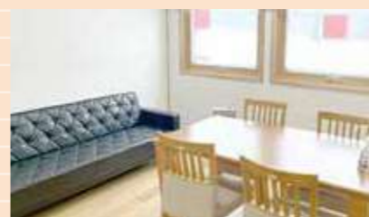
カウンセリングルーム