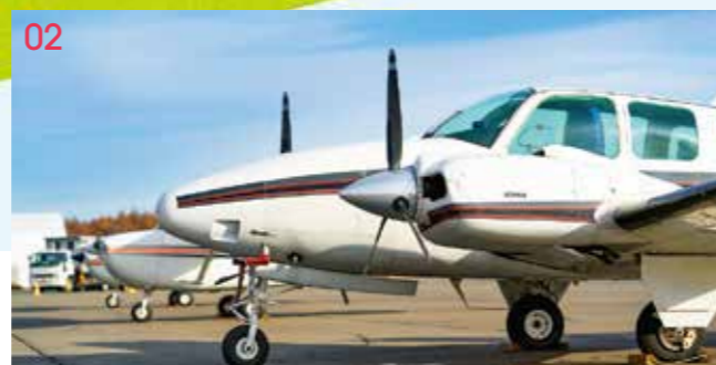
02 ランプ（駐機場） 飛行機を駐機する場所。飛行機のエンジン試運転などの実習を行う。