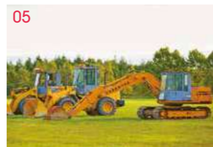
05 建設系車両実習場 建設系車両の資格取得に向けてトレーニングを行う。