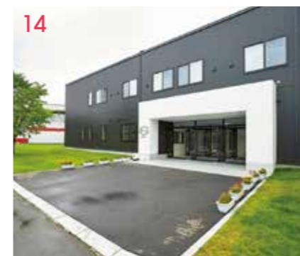
14 アメリカホール(女子寮) キャンパス内に学生寮があるので通学に便利! 2019年12月に増築され、収容人数が最大278名へ。