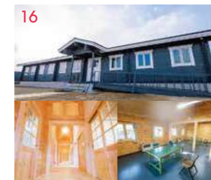
16 技能審査棟 航空整備士の国家資格取得のための技能審査試験会場を設立。