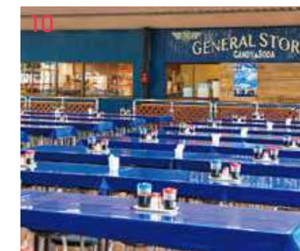
10 DINING HALL Rainbow (学生食堂) 480席もある学生食堂は、寮生だけでなく通学生の昼食時にも利用。