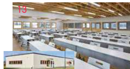
13 ダヴィンチホール(教室棟) 木目をいかした温かみのある教室。