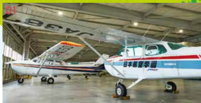
01 ハンガー（機体格納庫） 実習用の小型機やヘリコプターが格納されているハンガー。