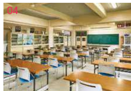
04 教室棟 大型機や電気系の実習、講義を行う。