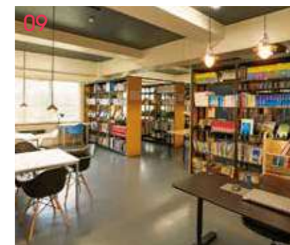
09 図書室 航空分野だけではなくさまざまなジャンルの本を取りそろえたカフェ風の図書室。