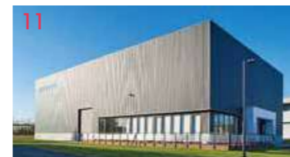
11 キャビントレーニングセンター (CTC) エアバスA330、A380のモックアップを設置。